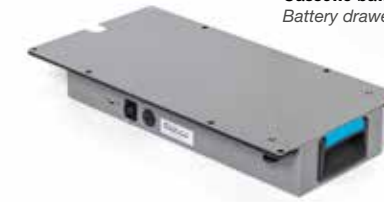
Cassetto batteria fissato sotto al carrello. Battery drawer fixed under the trolley.